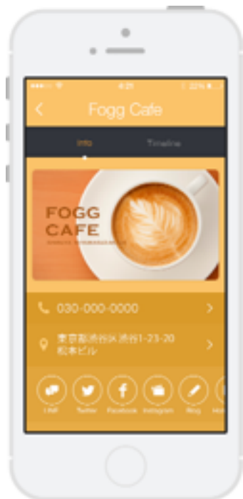
< プロモーションカード画面 >